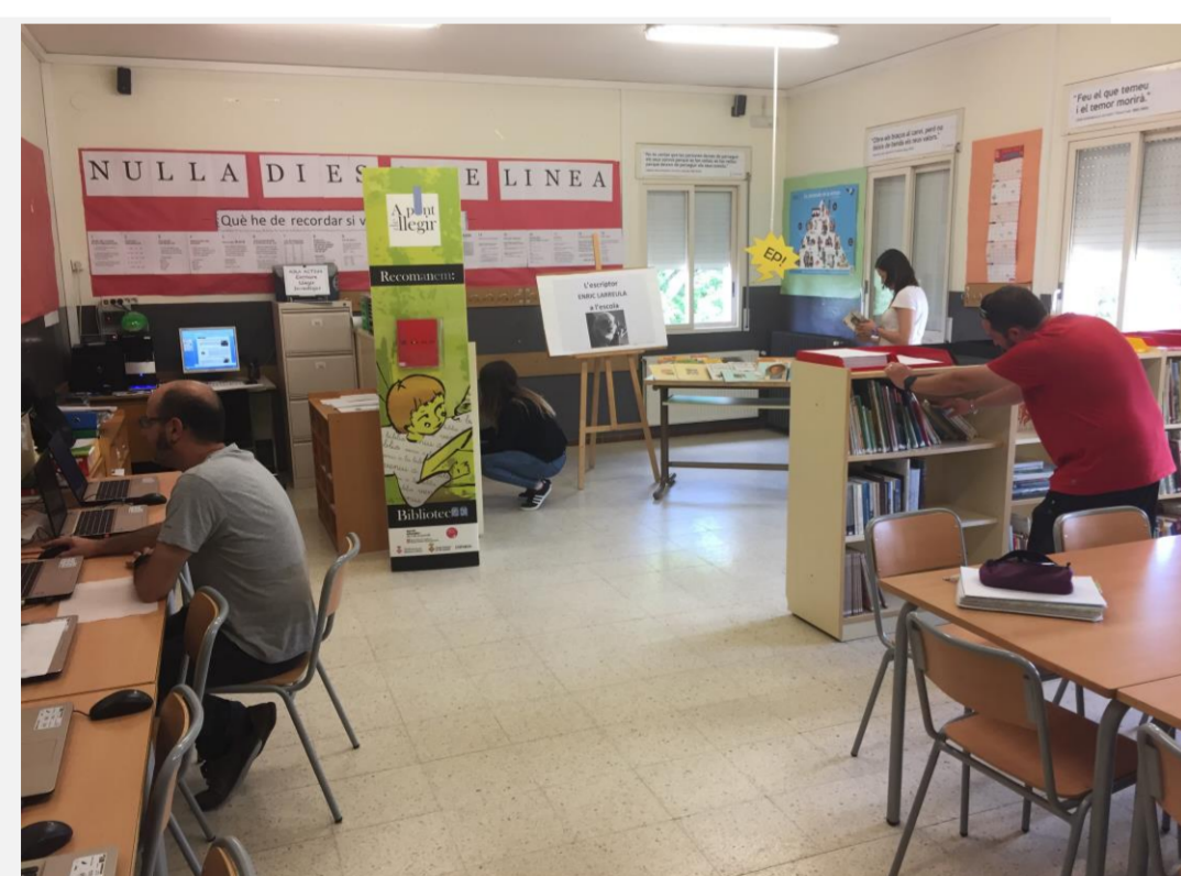
L'aula en procés de canvi, amb els primers llibres i els ordinadors que hem aconseguit