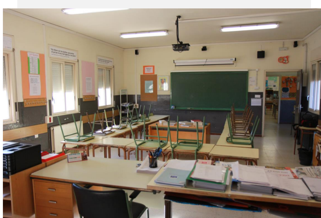
L'aula del taller d'escriptura abans dels canvis

A l'escola teníem, per una banda, una mediateca totalment obsoleta i, per l'altra, una aula de composició escrita amb diverses mancances i sense cap llibre de lectura ni de consulta. L'objectiu pel qual hem treballat ha estat el de crear una aula activa amb una triple funció: que continués essent un taller d'escriptura, que incorporés la lectura i que posés a l'abast dels alumnes uns ordinadors per tal de poder escriure, consultar i fer recerques diverses. D'aquí el lema que hem triat: volem que la nova aula s'assemblés més a una fàbrica que no pas a un magatzem.