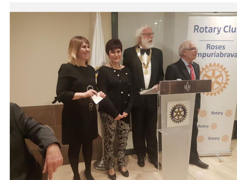
Sopar de lliurament de l'ajuda econòmica que ens ha atorgat a Rotary Club, amb l'alcalde de Roses i la directora de l'escola