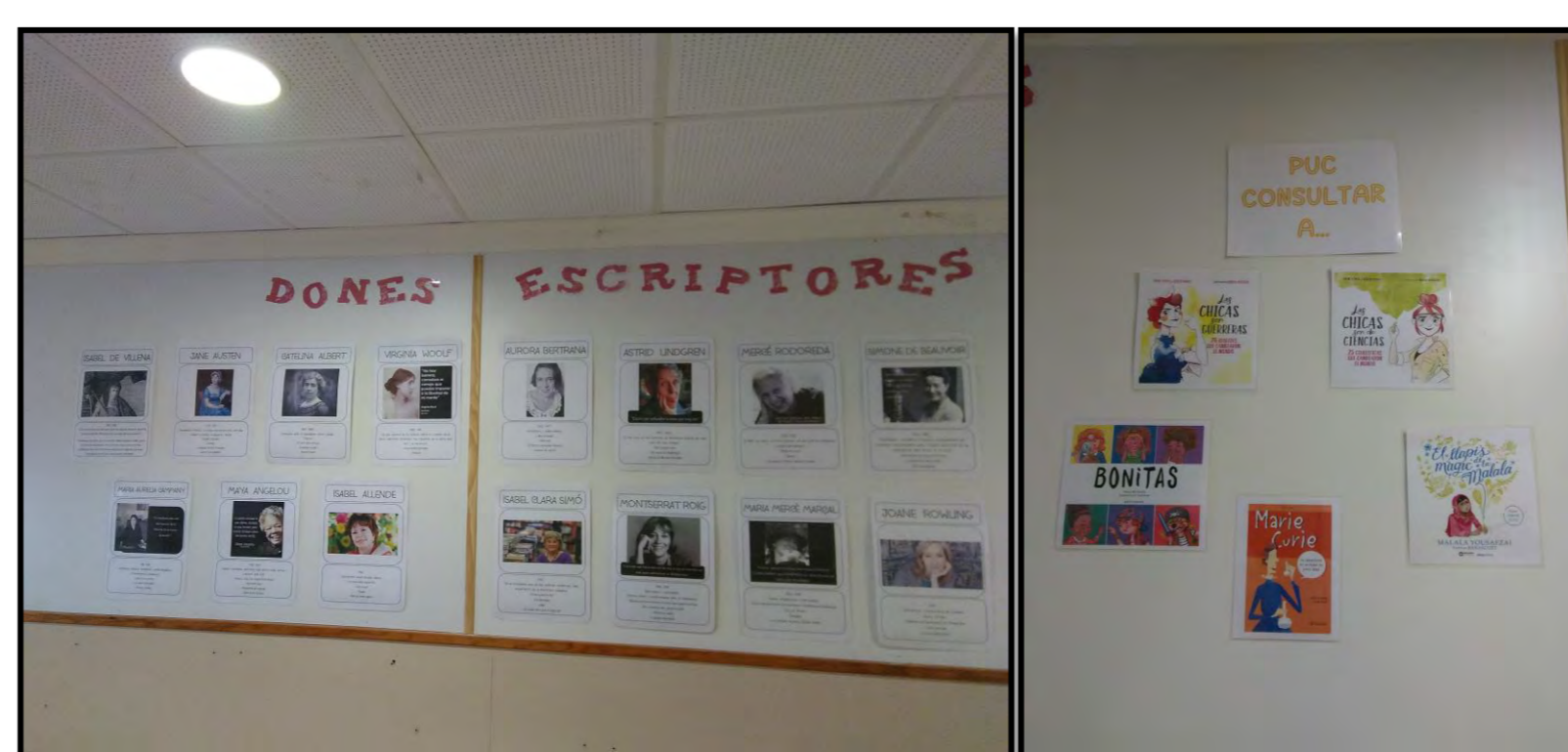
Cartellera pel dia de la dona, mostrant novetats per l'ocasió.

Pel curs vinent es vol introduir la formació d'usuaris a principi de curs i crear un tutorial per fer una bona recerca.